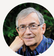
Profesor Svein Sjøberg

Presidente del Instituto de Desarrollo y Alternativas Económicas [Institute of Development and Economic Alternatives] (IDEAS)