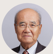
Dr. Koichiro Matsuura

Presidente del Comité de Selección, Premio Yidan Ex-Director General de la UNESCO